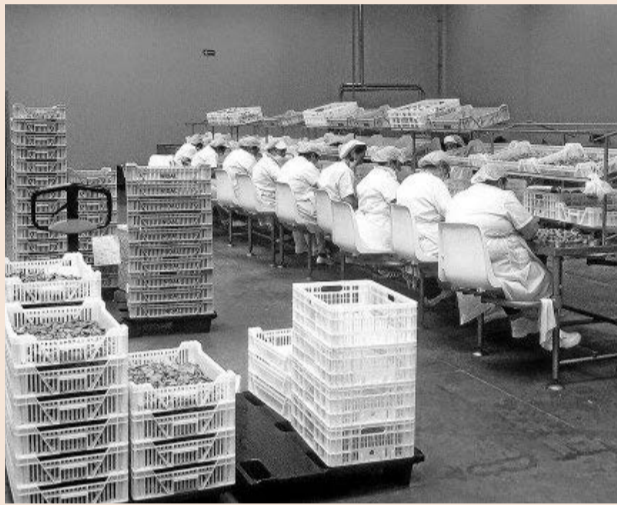
Portomar tiene previsto incrementar su plantilla este mismo año.

Para apuntalar ese crecimiento en el mercado español, Alonso contempla el lanzamiento de un par de productos más: las anchoas y el